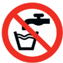
Abbildung 2: Zeichen für „Kein Trinkwasser“

Nichttrinkwasserleitungen sind nach der Trinkwasserverordnung und nach DIN 2403 eindeutig und dauerhaft farblich unterschiedlich zu kennzeichnen, damit es zu keiner Verwechslung kommt. Alle Entnahmestellen der RWNA sind mit einem Schild „Kein Trinkwasser“ oder dem Bild (Abb.2) zu kennzeichnen.